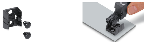
Fixation de la plaque de montage avec ri- vets de fixations