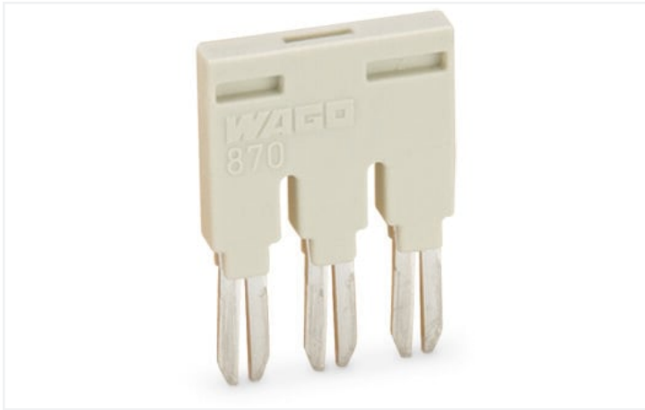
Farbe: ■ lichtgrau