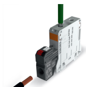
Passage pour conducteur primaire