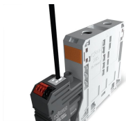
Technique de connexion par enfichage direct Push-in CAGE CLAMP®