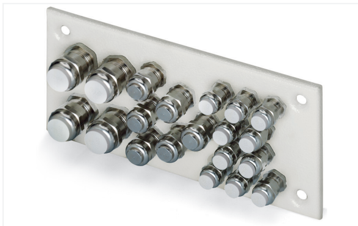
Identique à la figure