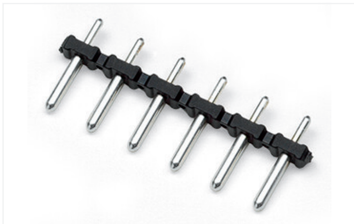
Couleur: ■ noir