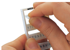
Détachement d'une bande de la carte WMB.