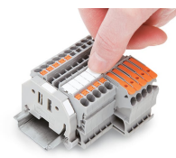
Encliquetage d'une bande de marquage WMB dans le logement de marquage