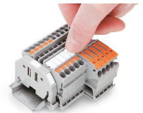
Encliquetage d'une bande de marquage WMB dans le logement de marquage