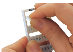
Détachement d'une bande de la carte WMB.