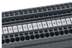
Repérage décimal WMB