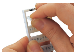
Détachement d'une bande de la carte WMB.