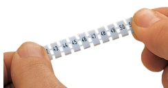
Pose d'une bande de repérage WMB