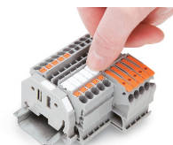
Encliquetage d'une bande de marquage WMB dans le logement de marquage bornes supérieures