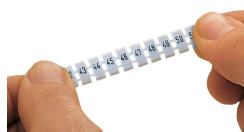
Pose d'une bande de repérage WMB