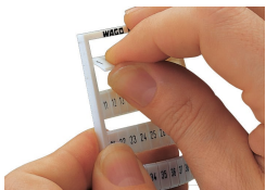
Détachement d'une bande de la carte WMB.