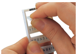
Détachement d'une bande de la carte WMB.