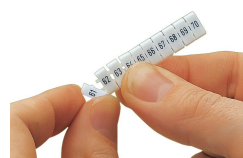
Détachement d'une étiquette de la bande de marquage WMB, pour les largeurs de bornes supérieures