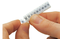
Détachement d'une étiquette de la bande de marquage WMB, pour les largeurs de bornes supérieures