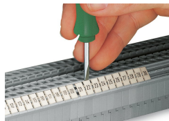
Encliquetage d'une bande de marquage WMB dans le logement de marquage