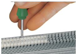
Encliquetage d'une bande de marquage WMB dans le logement de marquage du double porte-étiquettes