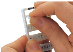
Détachement d'une bande de la carte WMB.