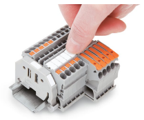
Encliquetage d'une bande de marquage WMB dans le logement de marquage