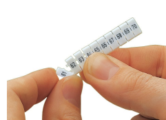
Détachement d'une étiquette de la bande de marquage WMB, pour les largeurs de bornes supérieures