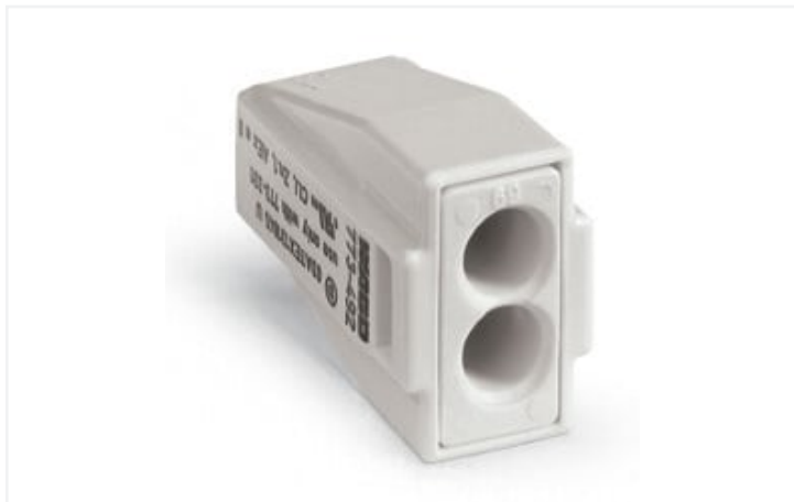
Farbe: ■ lichtgrau