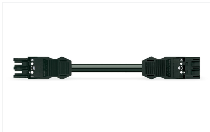
Farbe: ■ schwarz