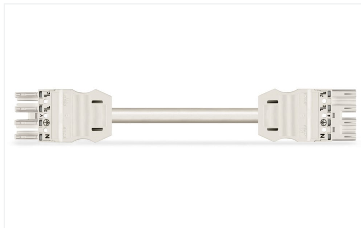
Dimensions en mm