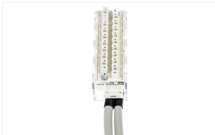
Identique à la figure