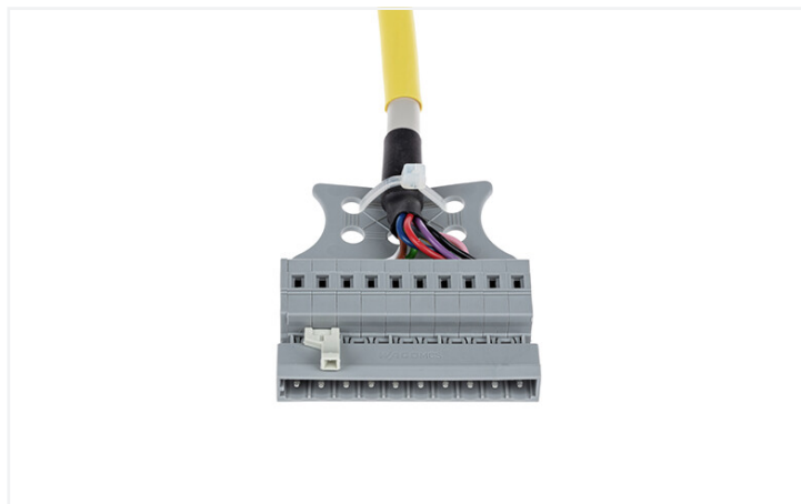
Identique à la figure