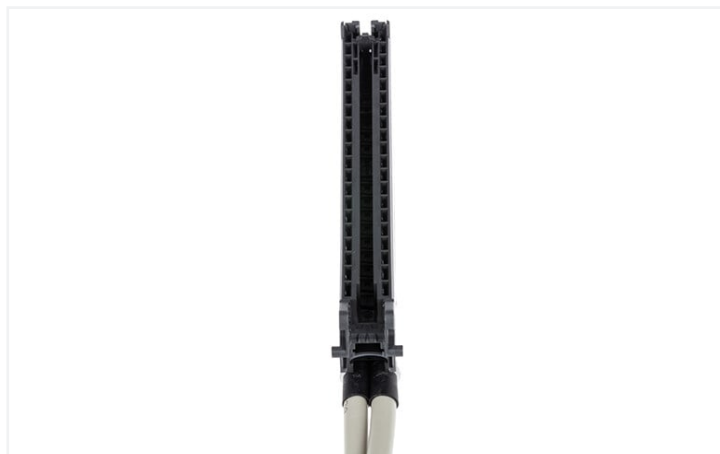
Identique à la figure