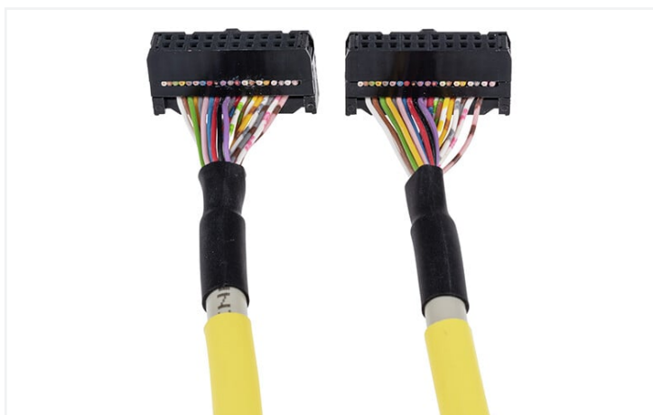
Identique à la figure