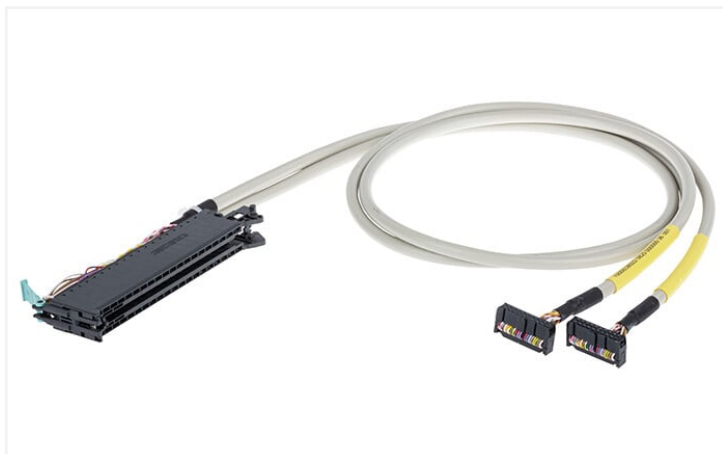
Identique à la figure