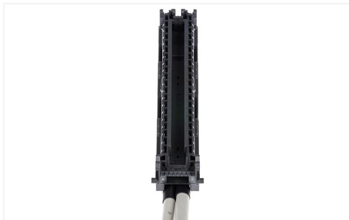
Identique à la figure