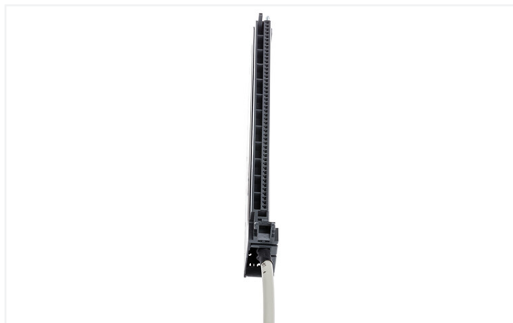
Identique à la figure