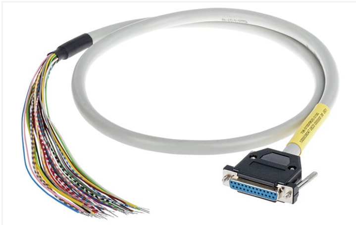
Identique à la figure