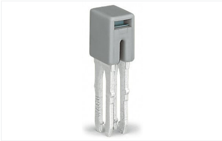
Farbe: ■ grau