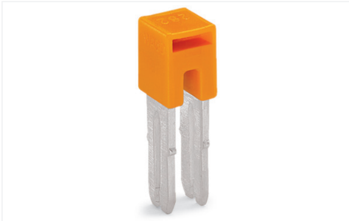
Farbe: ■ orange