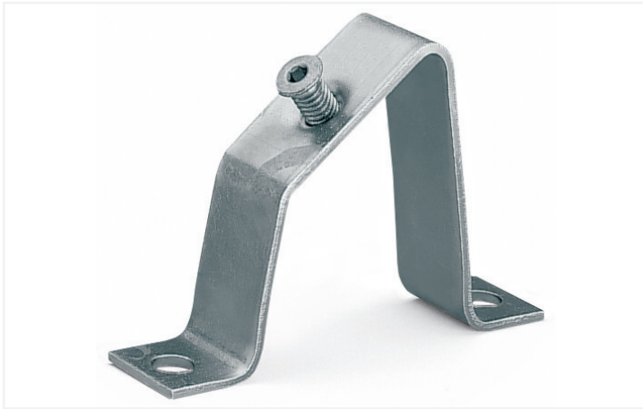
Identique à la figure