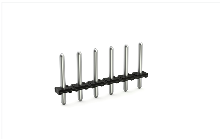
Couleur: ■ noir